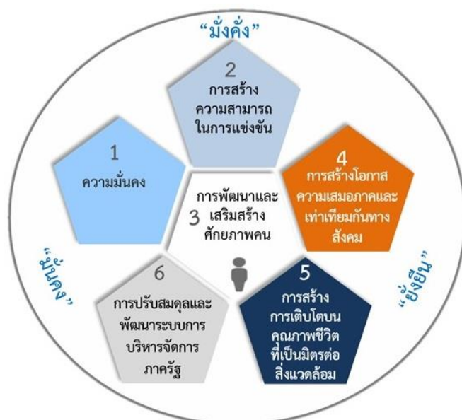
ภาพที่ 1 กรอบแนวทางการพัฒนาในระยะ 20 ปี